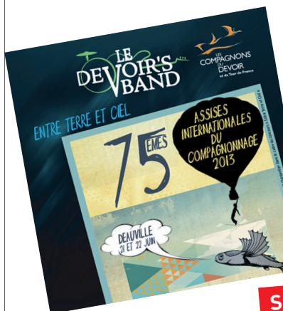
Entre Terre et Ciel , Assises 2013, Deauville, n° CDD-2013-001, chez W48-MUSIC (3 songs).