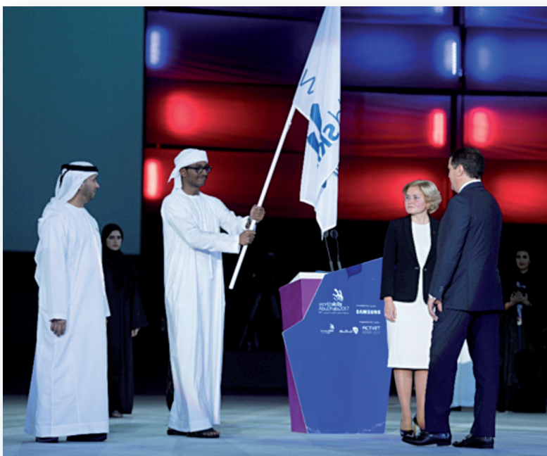
Handing over the Worldskills flag by the United Arab Emirates to Russia. Passation du drapeau de Worldskills entre les Émirats Arabes Unis et la Russie.