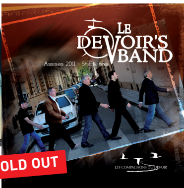
Travaille et chante , Assises 2011, Saint-Étienne, Sold out.