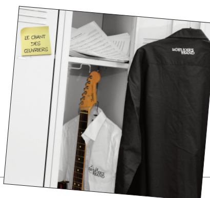
Le Devoir's band Le chant de Œuvriers n° 2016-001-LDB W48-MUSIC (18 songs + DVD bonus).