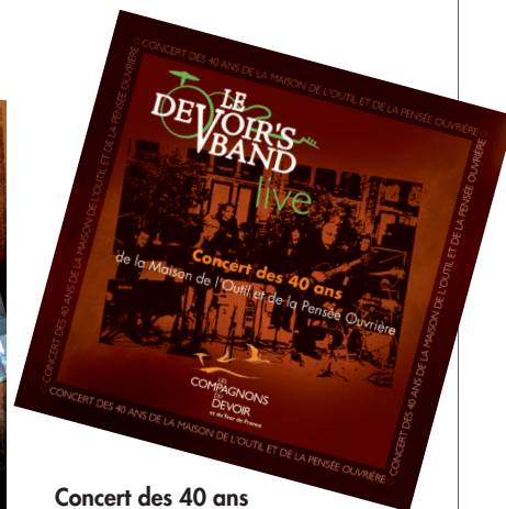
Concert des 40 ans de la Maison de l'outil et de la pensée ouvrière (LIVE IN MOPO), n° 2014-002-LDB, W48-MUSIC (15 songs).